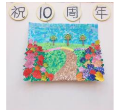
住人とスタッフ手づくりの貼り絵が「花」を添えました

10 月 27 日、10 年間の愛逢の家の思い出を、駆けつけてくださったホームホスピスの仲間と共にみなさんで分かち合い、お祝いしました😊