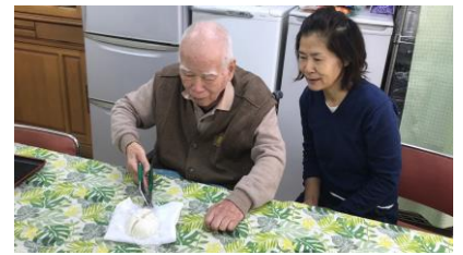
鏡開き、このお餅は善哉に

1月11日は、鏡開きをして、ぜんざいを振る舞いました。 ♥毎月11日、虹のふれあいセンターを覗いてみてください。