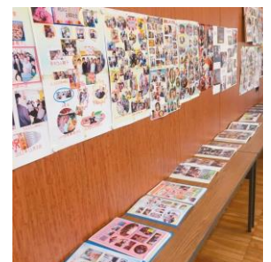
これからも思い出のアルバムが増えていきますように

そして、みなさんとともにこれからの一日一日、愛逢の家のもの語りをつくっていただけると幸いです😊 (西山裕規)